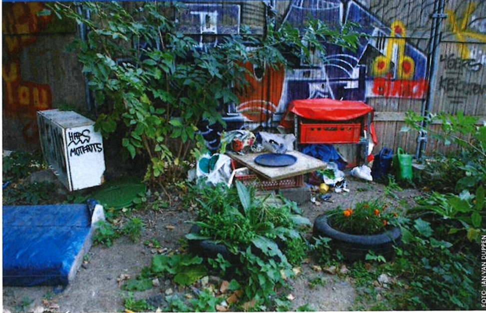
Guerrilla garden in een hoek van het terrein.