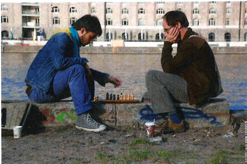
Ver van alle stadse drukte schaken aan de Spree.

De Cuvrybrache ligt al meer dan vijftien jaar braak. Op het terrein van 70 x 180 meter was vóór de val van de Muur een pakhuis geves-