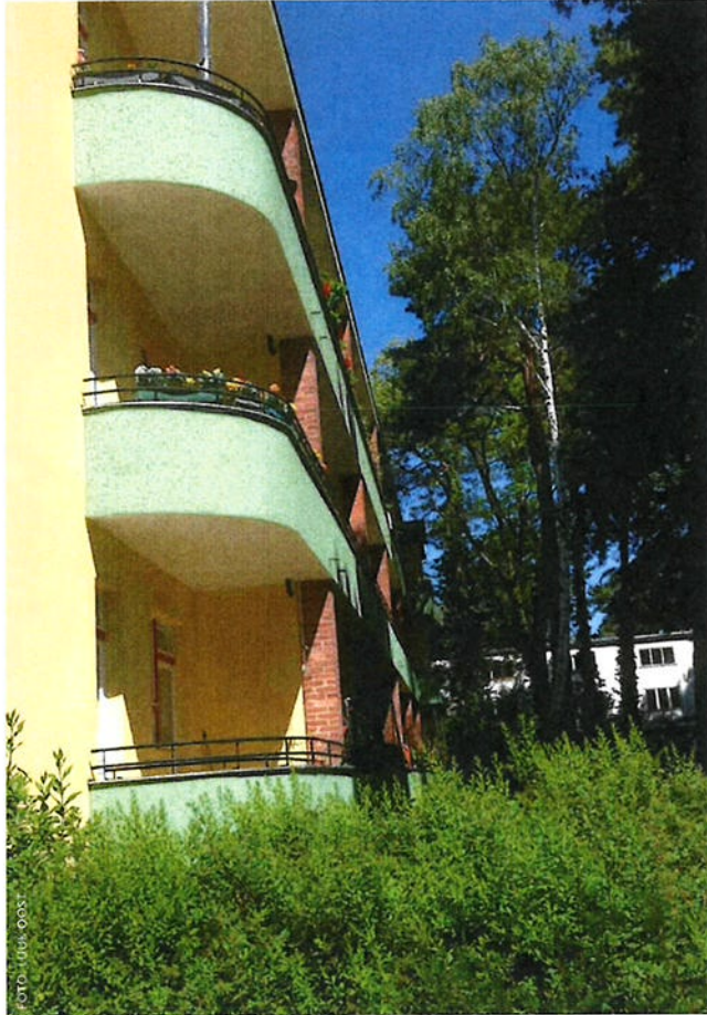
Etagebouw in de directe omgeving van metrostation Onkel Toms Hütte. De balkons en loggia's van de appartementen zijn 'democratisch' op zon en licht georiënteerd, zodat ieder gezin ervan kan profiteren.

De vakbonden zagen het directe belang van betaalbare woningbouw voor hun leden en richtten daarom woningbouwcorporaties op. Belangrijk uitgangspunt was dat de realisatie van betaalbare sociale woningen economisch verantwoord moest gebeuren. Anders gezegd, de woningbouwcorporaties zouden worden geleid als private ondernemingen met winstdoelmerk. Het rendement zou worden aangewend voor nieuwe bouwprojecten en niet toevloeien naar private aandeelhouders. Het werd mogelijk geacht het kapitalisme sociaal te 'herprogrammeren' door in de woningbouw beter te presteren. Sociale woningbouw dient zich te richten op wat nodig is, niet op wat iemand kan betalen.