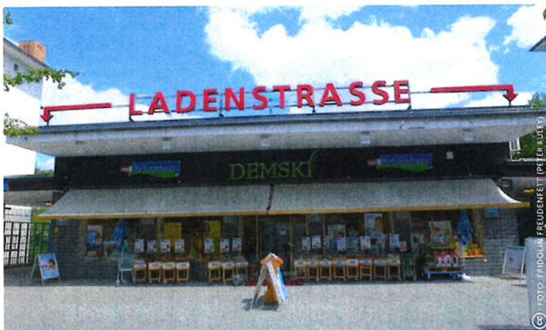
Het metrostation Onkel Toms Hütte ligt in een overdekte goot en heeft een eilandperron. In het dak zit een glazen koepel, waardoor er daglicht op het perron valt. Parallel aan de sporen zijn winkelpassages ( Ladenstraßen ) aangelegd.

Vanaf de Kurfürstendamm brengt U-Bahn 3 je in een halfuur naar eindstation Krumme Lanke in het zuidwesten van Berlijn. Vanaf station Thielplatz reis je 3 kilometer over een met private middelen gefinancierd spoor. De ruwbouw van het spoor, kosten van de grond en bouw van het eindstation kwamen rond 1925 voor rekening van de bouwondernemer Sommerfeld. Gelijkertijd bedong hij een concessie van het gemeentelijk vervoerbedrijf, de Hochbahngesellschaft, voor de commerciële exploitatie van het voorlaatste station, Onkel Toms Hütte. Met winkels, bioscoop, garage, woningen en postkantoor wilde Sommerfeld dit station tot middelpunt van een suburbane ontwikkeling maken, een Multifunktions-, Konsum- und Wohn-Komplex .