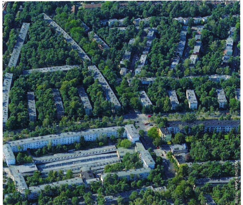
Model van de Grosssiedlung Onkel Toms Hütte, met parallelle etagebouw en groene stroken daartussen.

Niet de meest ideale oplossing in de ogen van Martin Wagner, omdat zo toch sprake was van subsidiëring van sociale woningbouw en afhankelijkheid van de grillen van de politici. Hij was pragmatisch genoeg om de beschikbaar komende middelen wel te benutten, maar de geldkraan werd na enige tijd dichtgedraaid – precies zoals hij voorspeld had. In zijn prachtige boekje Wohnungsbau und Weltstadtplanung. Die Rationalisierung des Glücks zoekt hij naar methoden en benaderingen om de woningbouw aan de kostenkant te beïnvloeden. Deze beschouwingen zijn fascinerend omdat in de recente sociale woningbouw in Nederland de sluitende exploitatie juist vaak werd gezocht in het oprekken van de opbrengstpotentie, c.q. de marktwaarde van de woning. Besparing aan de kostenkant verdween even van de radar bij de corporaties. Dit is deels begrijpelijk omdat bij de verkoop dan wel aankoop van grond door gemeenten vaak werd uitgegaan